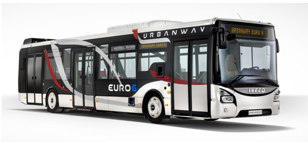
12 m Bus Low Floor - Cursor 9 Diesel EURO VI